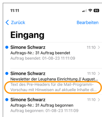
Abbildung 2 Bsp. Darstellung des Pre-Headers bei Apple Mail