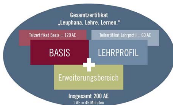
Abb. Programmstruktur sowie Inhalte Basisbereich

se trägt das Angebot zu einer höheren Lehrqualität und damit zum besseren Lernertrag bei den Studierenden bei. Die Zielgruppe des Basiszertifikats „Leuphana.Lehre.Lernen“ sind dabei in erster Linie Nachwuchslehrende, bei denen didaktische Qualifikationen nicht – wie bei Lehrerinnen und Lehrern nach einer Lehramtsausbildung – zu Beginn ihrer Lehrtätigkeiten vorausgesetzt werden können (Hölscher & Kreckel 2006). Das Programm erreicht jedoch zunehmend auch erfahrenere Lehrende, die auf Grund karrieretechnischer Überlegungen eine systematische hochschuldidaktische Qualifizierung nachweisen wollen. Die Angebote im Erweiterungs- und Profilbereich , aber auch maßgeschneiderte Angebote für Studienprogramme zielen auf eine Vernetzung von Lehrenden, auf ein Explizieren von Lehrhandeln und die Vermittlung spezifischer bzw. vertiefter Inhalte.