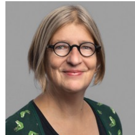
Academic Director for Liberal Education