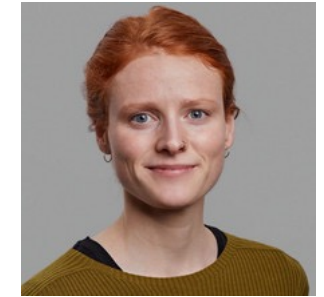
Koordination: Charlotte Gohr